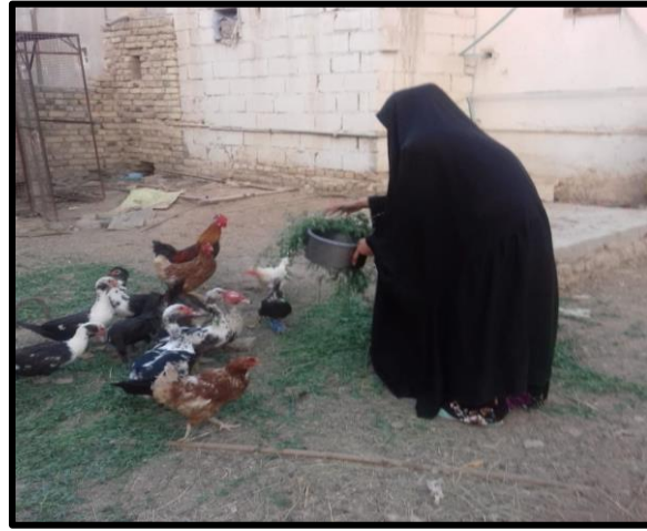
صورة (2): تغذية الدجاج في ريف مركز قضاء السماوة

الزراعة لما تتصف به من سرعة نمو وإمكانية تربية أعداد كبيرة في مساحات محدودة قصر مدة تربيتها اذ لا تحتاج الى وقت طويل للاهتمام بها وتكبيرها اثناء مدة النمو ، فالطيور الداجنة صغيرة وتتأثر بسرعة ولا تحتاج الى استثمارات كبيرة وتتغذى على الحبوب ويعتمد على المرأة في تربية الدواجن بمختلف أنواعها وفي نواحي مختلفة من حيث التغذية والرعاية الصحية ورعاية الطيور والاهتمام بأماكن اقامتها وغيرها (8) . صورة (2).