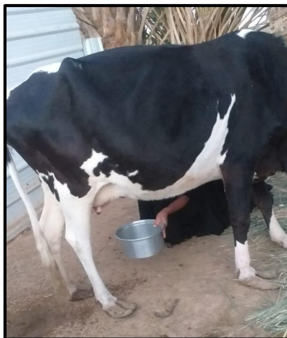
صورة (1): حلب الأبقار في ناحية الوركاء