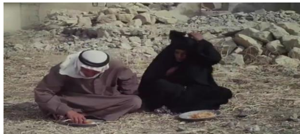
وینەیی ژماره (27)

- (گاره و سه‌فین) ناڤین دوو چیاين ديارين كوردستاني نه. ژ لايي سيميولوزيڤه چيا هيمايه‌كه بو بلندي، هيز، بهرگري، ژيان... هتد. ئەفە بخۆ وەکو ناسناڤ هاتينه بكارهينان. ئاماژه ب ئەفان هەردوو ناڤان د پەيوەندەين لاسلكيدا هاتيه کرن، لەمورا دبیت ئەم بخۆ بتنی ناسناڤين ئەكو ناڤين راسته‌قینه‌ين کەسایه‌تییان بن. - (سەدام) ناڤه‌کی عەربیه. ئەو بخۆ هەر وەکو د فیلمی بخۆدا ژ ی ئاماژه بو هاتیه دان کو ب ناڤی سەرۆکی عیراڤی یی ژ ناڤچووی (سەدام حسین) ی هاتیه ب ناڤکرین. داکو بهیته خەلاتکرین، چونکو نەریته‌ک ل دەڤ (سەدام) ی هەبوو ئەوین ب ئەوی د هاته ب ناڤکرین دهاتنه خەلاتکرین. سێ کەسایه‌تییین سەرەکی د ئەفی فیلمیدا هەنه. ئەف چەندە ژ ی ب ریکا (مەملانی، بریار و قەدین) ئ دیاردبیت (کاوغیل، 2013: 106-117). کەواته چەوايیا نیاسینا کەسایه‌تییین سەرەکی یا گریدايه ب: - رادەیا دەرکەتتا ئەوان ل سەر شاشه‌یی. - چەوايیا نیشاندانا ئەوان ل سەر شاشه‌یی. - ئەو کار و کریار و بریارین ئەو دکن و بجه‌دهین.