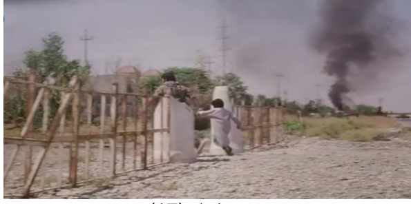
وینهيی ژماره (17)

ث- ناماژهيی دده‌ته جوړی فيلمی: ب ریکا بکاره‌ینانا دیکورین تایبته جوړی فيلمی دیارديت. ومکو کومیدی یان تراژیدی...هتد.