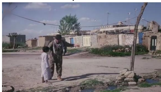
وینەیی ژماره (16)

دەرباره‌ی ئافاهی، ریک و دیکۆران ب شیوه‌یه‌کی گشتی دیاردبیت کو جه‌ه‌که شه‌ر لئ په‌یدابوویه. ئافاهین