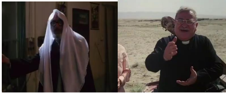
وینه‌یی ژماره (9)

ئابین هاتینه دیارکرن. ب ریکا دیارکرن کەسایه‌تین ئابینی. و مکو مه‌له و قه‌شه هاتینه دیارکرن.