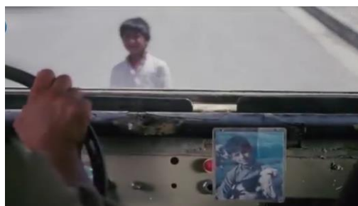
وینەیی ژماره (28)

- رەفتار: رەفتار دۆخه‌که ژ کارلیکرینی د ناڤه‌را مروف و ژینگه‌ها ژ دەرڤه‌دا. به‌هرا پتیریا جارن وەکو به‌رسڤدانه‌کا رەفتاری یا بده‌ستڤه‌هاتی و فیرووی دەرکەفت. هەروسا پیکه‌اتییه ژ هەر کریاره‌کا مروف ب شتیه‌یه‌کی دیار یان قەشارتی ئەنجامدەت. د سینه‌ماییدا؛ پیکه‌اتییه ژ ئەوان کار و کریارین کەسایه‌تی ئەنجامدەن. ب ریکا قەکرنا کۆدین ئەوان د شیاندايه چەند پیزانین، واتا و دەلاله‌تین جودا جودا وەرگیرین.