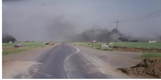
وینهيی ژماره (18)

ث- ناماژهيی دده‌ته جوړی فيلمی: ب ریکا بکاره‌ینانا دیکورین تایبته جوړی فيلمی دیارديت. ومکو کومیدی یان تراژیدی...هتد.