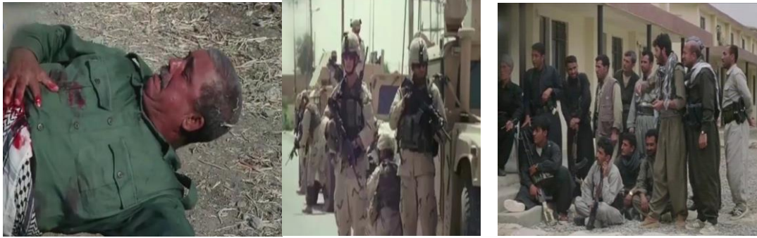
وینه‌یی ژماره (7)

- سەرباز هاتینه دیارکرن. سەربازین کوردی (پیشمەرگه) و بێن ئەمریکی و بێن عەرەبان هاتینه ژیکجوداکرن.