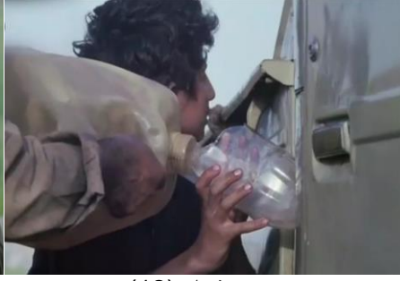
وینەیی ژمارە (12)

أ- ئەوین تاییەت ب دیمەنانقە: ناماژەیی دەنە جۆری جەیی و ئاستی ئەوی و جۆر و ئاستی کەسابەتیی لئ دژین. بۆ نمونە: