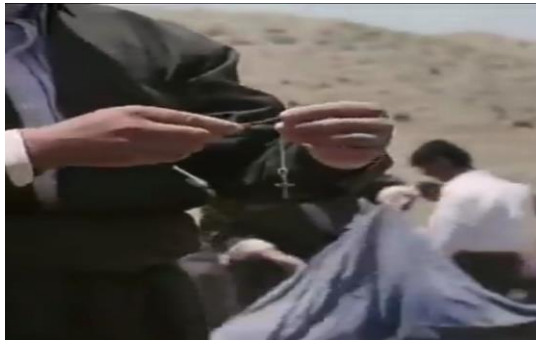
وینەیی ژمارە (14)

ب- ئەوین تاییەت ب ئەکتەرانقە: ئیکسیسوارین کەسینە، ئەوین ئەکتەر بکار دەهینن. بۆ نمونە: