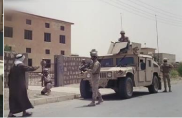
وینەیی ژمارە (35)