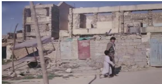
وینەیی ژماره (15)

هتد بیت(نایلی و سلمی، 2019: 40). د ئەفی فیلمیدا وەکو ئالفه‌کی گرنگ د گوتارا سینه‌ماییدا هاتییه دیتن، چونکو یێ هاریکاره بۆ په‌یدا کرنا ره‌هه‌ندی دراماتیکیی گونجای. ل دویف جوړی بابەتی ئەفی فیلمی سینه‌مایی؛ پشتبه‌ستن ل سه‌ر دیکۆرین ده‌ستنیشانکری و تاییه‌ت