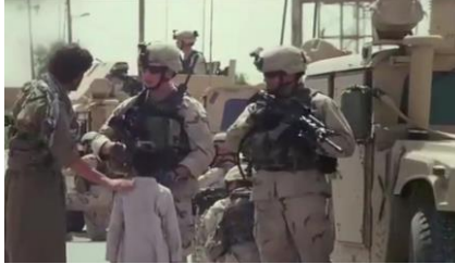
وینەیی ژمارە (36)

د وینەیی ژ مارە (33)دا، چەند پێشمەرگەیه‌کێن کورد کەیفخوشیا خو ب رئیا دهواتی دەرډېرن ب هەلکەفتنا نەمانا رژیما به‌عس و کەفتنا (سەدام)ی. هەموسا د وینەیی ژمارە (34)دا ژ چەند کەسه‌کێن عەرەب ب