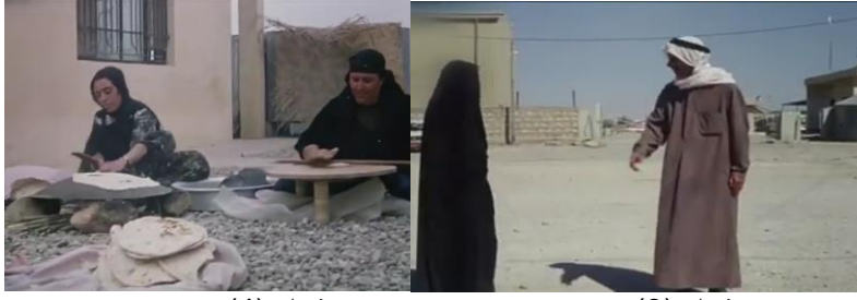
وینه‌یی ژماره (4)