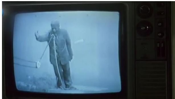
وینه‌یی ژماره (25)

97). پۆله‌کی گرنګ و سهره‌کی د ئاڤا کرنا گوتارا سینه‌ماییدا دگيرن، چونکو ئه‌و ناهنده ئه‌و رویدان ل دور دزقرن، ل دم و جهه‌کی دیارگری ژ ئاڤا کرنا چیکه‌رین گوتاری ب شيوه‌یه‌کی کو بینر ل گهل بژیت و کارتیکرنی ل هه‌ستین ئه‌وی بکه‌ت ژ لایئ قیان و کهر، داخبار و دلرشی .... هتد. ئانکو کهسایه‌تی ئالافی سهره‌کیه و ئالافین دی بین د خزمه‌تا دیار کرنا ئه‌ویدا. ب شيوه‌یه‌کی گشتی کهسایه‌تی د گوتارا سینه‌ماییدا دبنه چند جوره‌ک. ئه‌و ژی (کهسایه‌تیین لیزفرینه‌ر، کهسایه‌تیین ئاماژه‌کهر، کهسایه‌تیین بیره‌نهر) (هامون، 2013: 14). د ئه‌فی فیلمیدا نواندا چیرۆکه‌کا راسته‌قینه‌یی هاتیه‌ کرن، له‌ورا کهسایه‌تیین ئه‌وی به‌هرا پتر بین لیزفرینه‌رن. ئه‌ف چنده ژی د فیلمی بخودا ئاماژه پئ هاتیه دان.