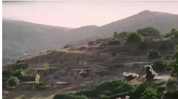
وینه‌یی ژماره (23)

2- شپوه‌کاری: ټانکو جه ل گهل دهوروبه‌ری دهیته ریځستن ب هاریکارییا رهنګ و پروناهیبی بۆ هندئ جوانی و کویری و پیکهاتیا نه‌وی دیاربیبت کو وه‌کو که‌قالین شپوه‌کاری لیده‌یت.