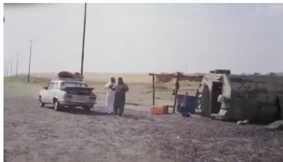
وینه‌یی ژماره (24)

3- فیلمی: هر جه‌کی رویدانین فیلمی لی په‌یدابن کو چ هه‌بوونا راسته‌قینه‌یی نینه، به‌لکو بۆ فیلمی هاتینه چکر و دهینه ژ نافبرن پشتی ب دوماهیک هاتنا وینه‌کرنی. بۆ نمونه: