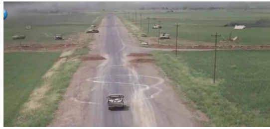
وینهيی ژماره (19)

ج- زیده‌کرنا ئالاقی جوانکارییی: جهی ب شیوه‌یه‌کی جوان نیشاندته و کیماسیان به‌رزه دکته. ح- ده‌ست‌نیشانکرنا قه‌باره‌ی: کو جهی نواندی ده‌ست‌نیشاندکته ئه‌چا چ یی مهن یان بچویک بیت.