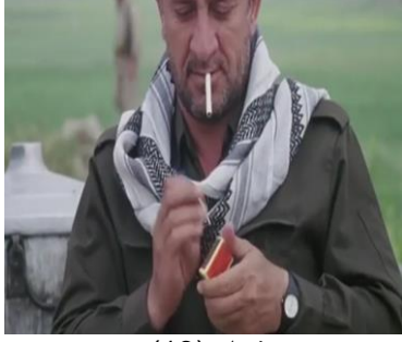
وینەیی ژمارە (13)