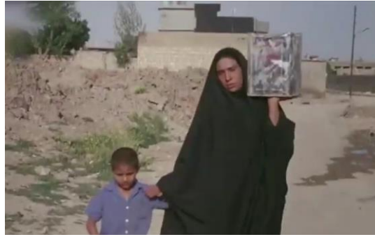
وینەیی ژمارە (13)

بکارهینانا (شخاتە)یی بۆ هەلکرنا ئاگرئ جگارەیی، هەروەسا جۆری ترومبیلی چەواییا داگرنتنا پانزینی؛ یین گونجاینە ل گەل ئەوەی دەمی یی فیلم باس لئدکەت. ب شتێوەیکئ گشتی دوو جۆرین ئیکسیسواران (بویکر و سلام، 2015-2016: 119). هاتینە بکارهینان، ئەوژی: