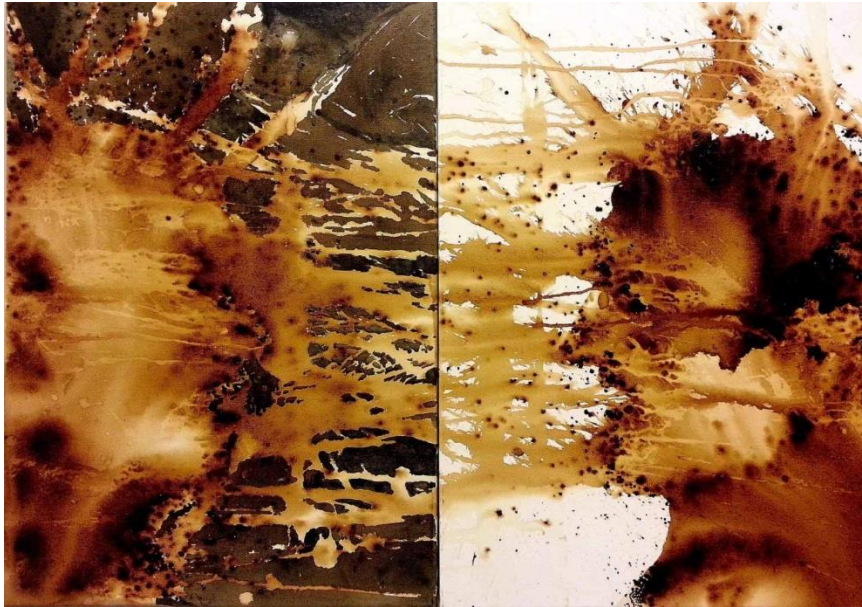
مروقه‌کانی ئەم سەردەمە - 1 - / 2015 / 140x100 سم