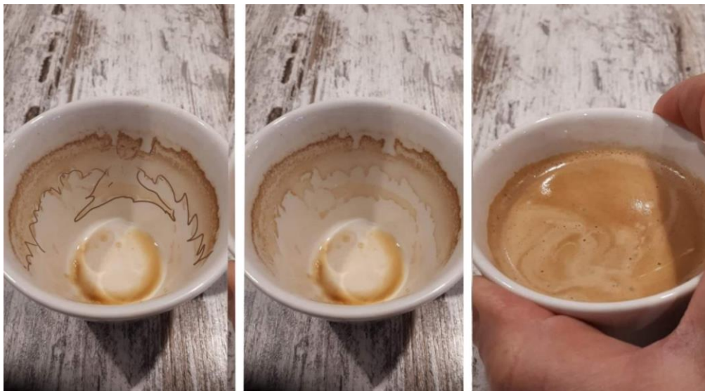
فنجانی قاوه - 5 -