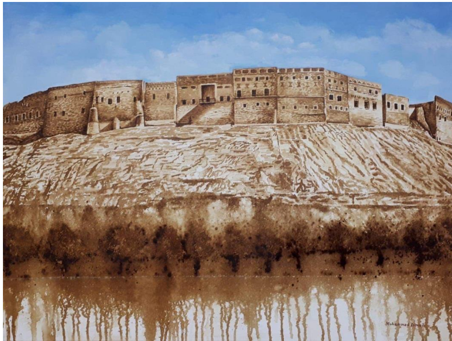
قه‌لا - 4 - / 2017 / 70x50 سم