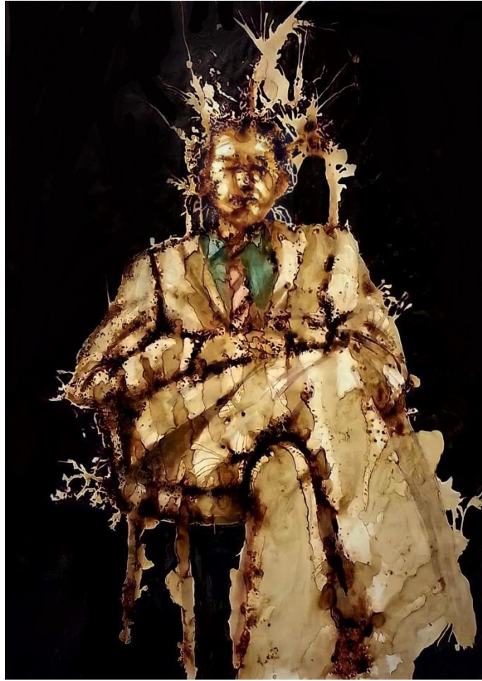
بیرکردنهوه - 2 - / 2015 / 150x250 سم