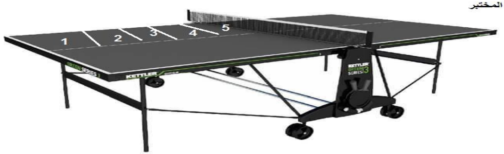
شكل (1) اختبار ارسال الامامي دورات جانبي