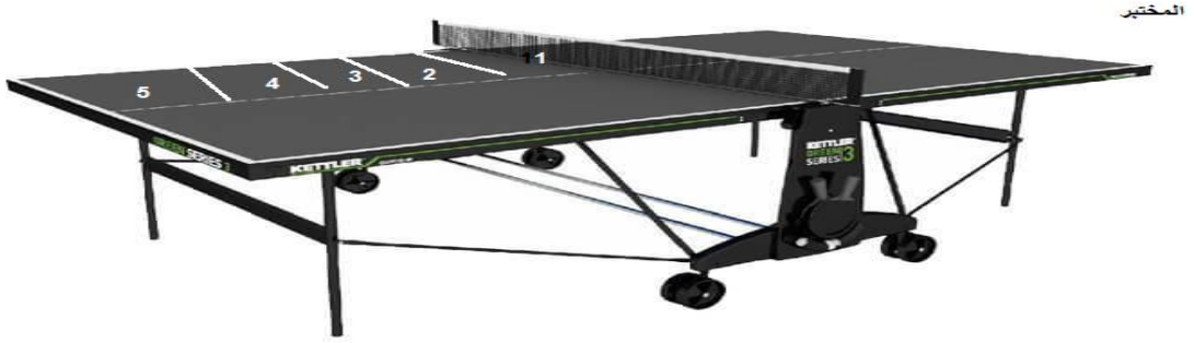
شكل (2) اختبار ارسال الخلفي دوران جانبي

الباحث لكي لا يقع في الأخطاء أو الصعوبات أو المشاكل أثناء التجربة الرئيسية.